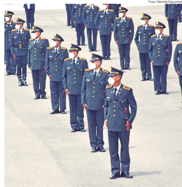
Aspirantes a soldados se forman en el campo Marte.

En la Escuela de Formación de Soldados Vencedores del Cenepa se forman jóvenes de diferentes partes del Ecuador.