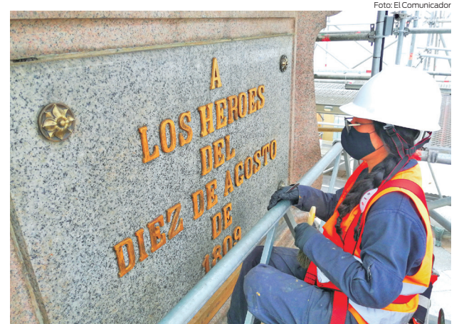
Una joven limpia con diferentes químicos las letras incrustadas en la piedra. Además, de realizar un proceso de pulido de las letras.

Los obreros se encargaron de limpiar, lijar y pintar las placas alusivas a los héroes del 10 de Agosto de 1809 y los bordes de hojas de acanto. Además, de la imagen del cóndor que rompe una cadena en alusión a los procesos libertarios del pueblo quiteño y el pedestal rodeado por cuatro columnas corintias decoradas con apliques de bronce en forma de palmas y hojas de laurel. Mientras que las columnas, que rematan en una pequeña base con forma de cruz sobre la que se encuentra la escultura de