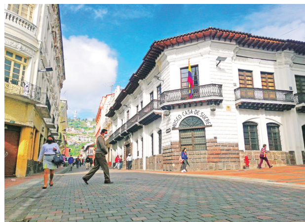
El museo de la Casa de Sucre se encuentra en el Centro.