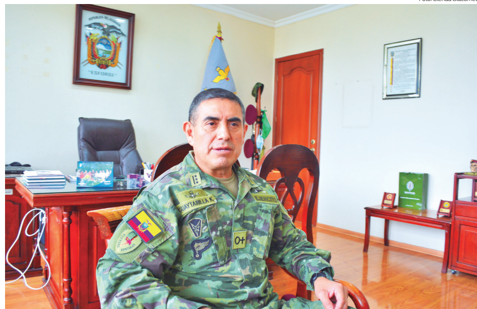
El director de la Esforse aseguró que esta fecha se la debe recordar con unción cívica.

Fue la noche del 23 de mayo de 1822, que el ejército de Antonio José de Sucre integrado por 2.971 hombres que empezaron a escalar el volcán, que buscó la mejor ubicación para la batalla.