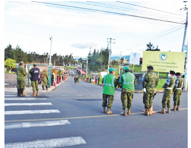
Huachi Grande no fue un buen sitio para las guerras.