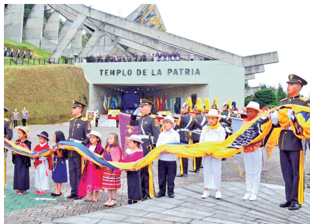
Los eventos se realizarán en el Templo de la Patria

El Templo de la Patria En la ladera suroccidental del Volcán Pichincha se encuentra la conocida Cima de la Libertad, en donde se construyó la monumental obra arquitectónica el “Templo de la Patria”. La edificación comenzó a construirse desde 1920, al cumplirse el primer centenario de la gesta histórica. El presidente José Luis Tamayo construyó un obelisco en la Cima de la Libertad y desde esa fecha se han