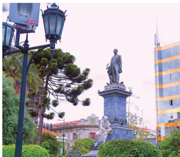
El monumento al escritor ambateño está en Ambato.

zuela hasta Bolivia libertando a los pueblos, que por esa razón el escritor ambateño se dedicó a exaltar y magnificar toda la epopeya. El director general de la Casa de Montalvo dijo que la libertad que deberíamos ostentar en la actualidad como legado de los grandes libertadores.