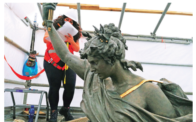
Montada sobre una estructura metálica se encuentra una obrera que toma las medidas de la principal escultura del monumento.

la dama de la independencia “Libertad”, Diosa romana, que, desde su concepción, ha sido el símbolo de la libertad del pueblo, fueron repintadas.