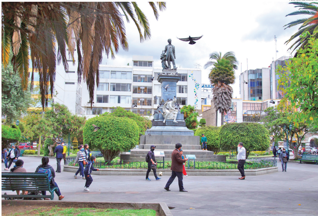
A través de la Cátedra de Montalvo, la Casa de Montalvo, hace conocer de la vida, obra y pensamiento del escritor.