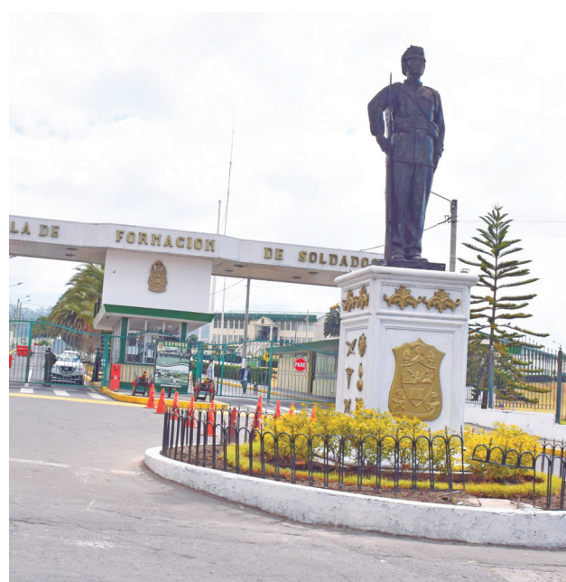
En 1990 se formó la Esforse.

ciudadanía revalorice la verdadera gran dimensión de estos actos heroicos. Queremos dejar impregnado cómo fue esta gesta heroica. Transcurridos 200 años es el llamado a mantener ese espíritu de lucha y superación. Las Fuerzas Armadas se comprometen con nuestro trabajo en la defensa y fortalecimiento de nuestra democracia”.