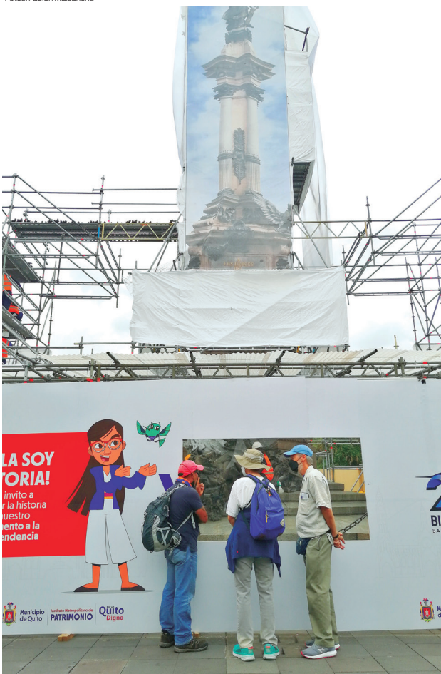
Los obreros colocaron un valla metálica y la cubrieron de una tela blanca para impedir que las personas ingresen a la zona de los trabajos de restauración.