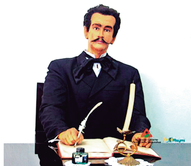
En la Casa de Montalvo hay una representación del escritor