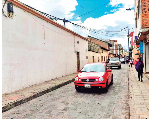
La Calle Dos de Mayo de Latacunga trasciende en la historia, por aquí pasaron las tropas libertarias.

resolvió por unanimidad declarar el Día de la Hospitalidad Latacungeña porque se mantiene la calidez, amabilidad y colaboración